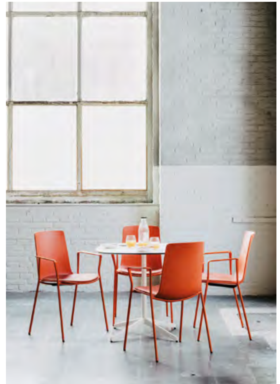
Lottus AL table (ref. 4947), lacquered structure in RAL 9016 and white HPL top. Lottus High (ref. 6200).