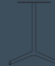
CIRCULAR TOP H 720 Ø 600/700/800/900