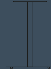
ROUNDED CORNER TOP H 720 Ø 600/700/800/900