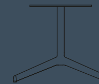
CIRCULAR TOP H 370 Ø 600/700/800/900