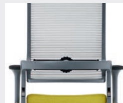
Eisengrau (RAL 7011) Iron grey (RAL 7011)