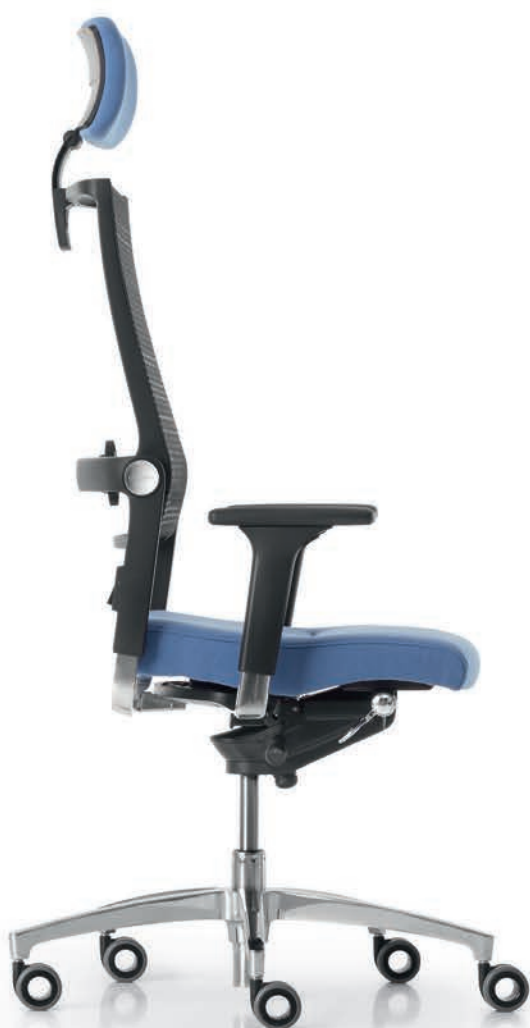
SD LO 3020 + Armlehnen | Armrests A441APO