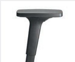
A240KGS (2F) Armauflagen PU Armpads PU