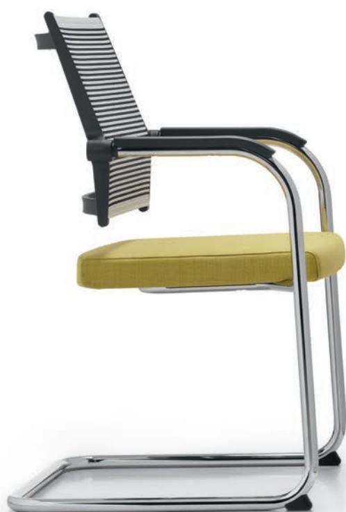
LO 3315 Armauflagen (PU) | Armpads (PU) AA03KGS

PAPE+ROHDE b ü r o e i n r i c h t u n g e n www.pape-rohde.de