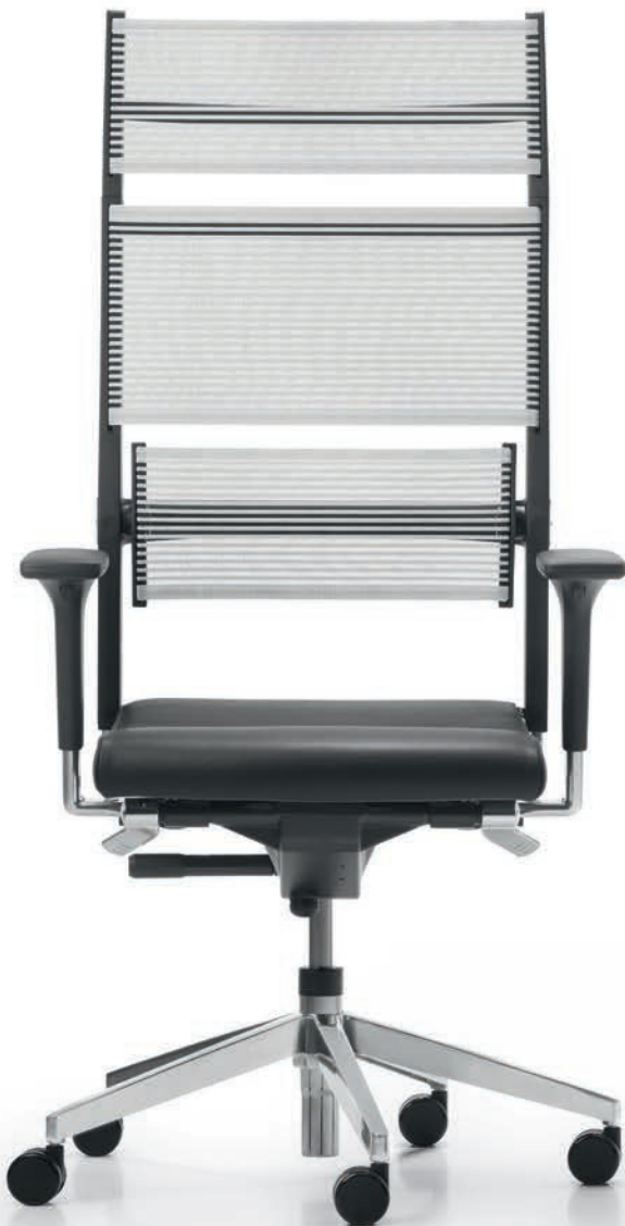
SD LO 3390 + Armlehnen | Armrests A441APO

The elegant seating solution for the executive floor. A great thing to look at – even better to sit on: the Lordo executive swivel chairs come equipped with our patented Syncro-Dynamic Advanced® mechanism, guaranteeing comfortable and constant body support. Both seat and backrest follow the user's natural way of movement, including keeping one's legs in a comfortable position at all times.