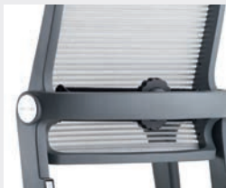
Lordosenstütze tiefenverstellbar (3,5 cm) Lumbar support depth-adjustable (3,5 cm)