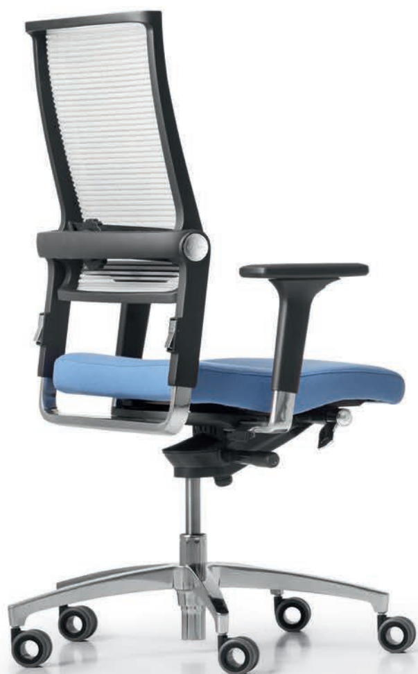
SD LO 3010 + Armlehnen | Armrests A441APO

PAPE+ROHDE büroeinrichtungen www.pape-rohde.de