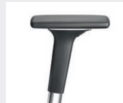
A541APO (5F) Armauflagen PU soft Armpads PU soft