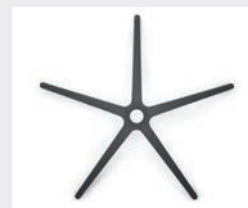
FHKS Kunststoff schwarz (Standard) Black plastic (standard)