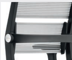
Lordosenstütze, pendelnd gelagert Lumbar support, swing-mounted