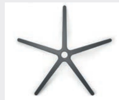
FHKEG Kunststoff eisengrau (Option) Plastic iron grey (option)