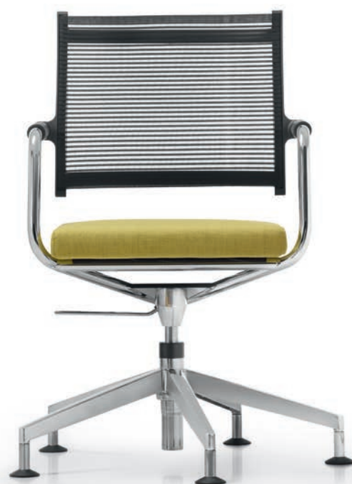
LO 3307 Armauflagen (PA) | Armpads (PA) AA01KGS