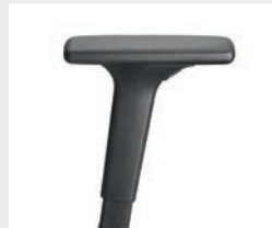
A441KGS (4F) Armauflagen PU soft Armrests PU soft