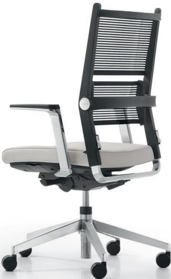
AS LO 3360 + Armlehnen | Armrests AS06APO

Visitor and conference chairs perfectly complete the Lordo product range. Their modern design and fully flexible mesh fabric backrest will be a true asset to both your guests and colleagues. There are a lot of functional options to pick from: The cantilever chairs are stackable, and the height-adjustable conference chairs are available with either gliders or castors.