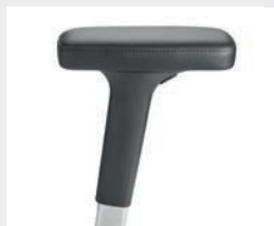
A442APO (4F) Leder-Armauflagen Leather armrests