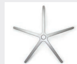
FHAPO Aluminium poliert (Option) Aluminium polished (option)