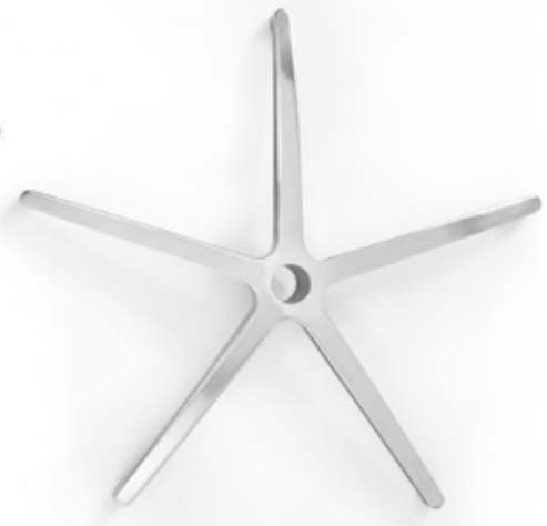
Poliert | Polished