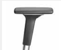
A541APO (5F) Armauflagen PU soft Armpads PU soft