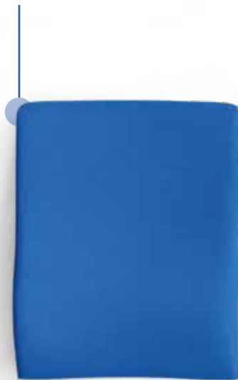
mittelhoch | mid-high