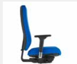
@Just magic2 XL/NPR Sitz- und Rückenpolster mit seitlichen Nähten, Farbe Polsterböden wie Farbe Sitz/Rücken Seat and backrest upholstery with side seams, same colour for facings and seat/backrest