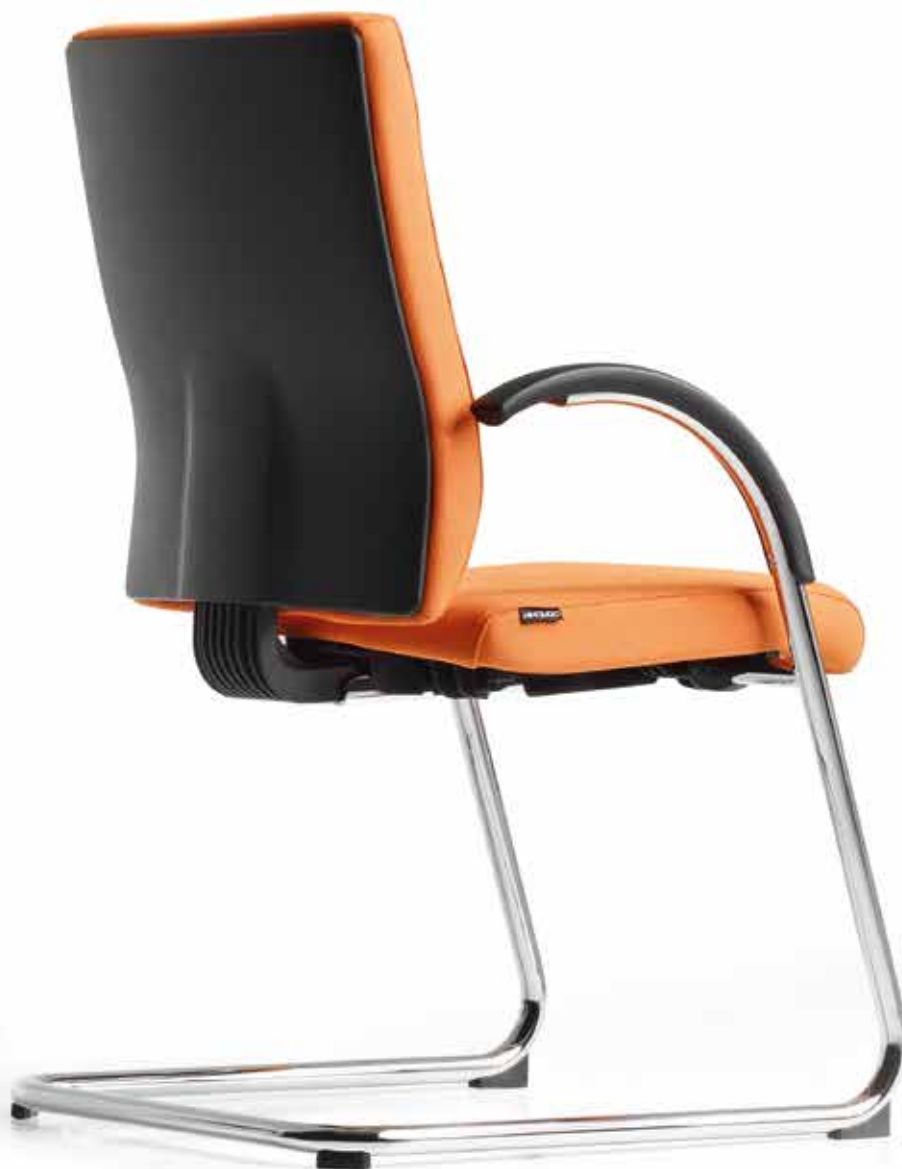
AJ 1435 Armlehnen | Armrests AA03KGS nicht stapelbar | not stackable