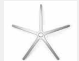
FHAPO Aluminium poliert (Option) Aluminium polished (option)