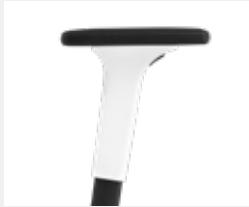
A241KGS* (2F) Armauflagen PU soft Armpads PU soft