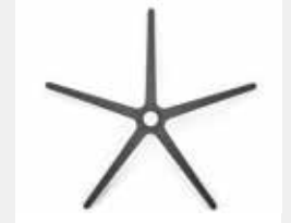
FHKGS Kunststoff schwarz (Standard) Black plastic (standard)