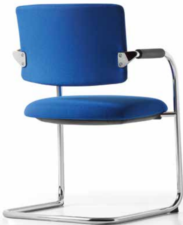
TO 3933 Armauflagen | Armpads AA01KGS 3fach stapelbar | stackable up to 3-high

Die überzeugende Ergänzung zum @Just magic2 operator Drehstuhl-Programm: Die Freischwinger bieten mit ihren komfortablen Vollpolster-Rückenlehnen besonderen Sitzkomfort für Gäste und Besucher.