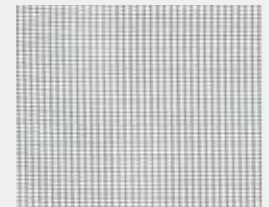
Web S (100% Polyester) Schwarz | Black (Standard)