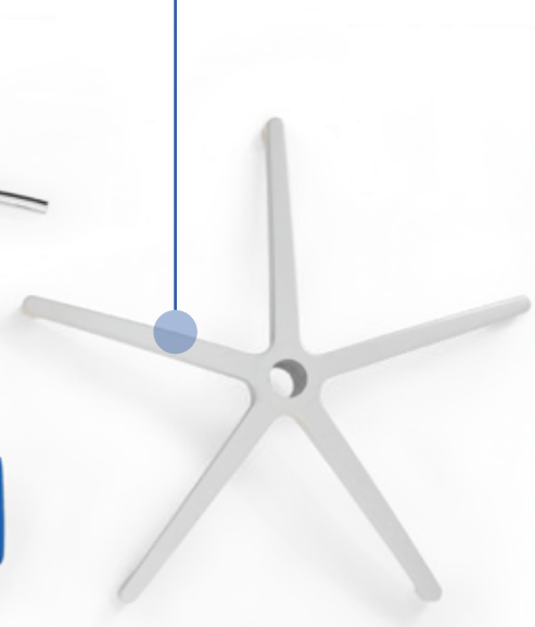
Silber | Silver Weiß | White (ohne Abb. | w/o ill.)