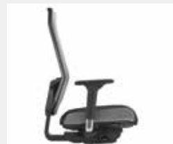
@Just magic2 XL/NPR Sitzpolster mit silbergrau abgesetzten Polsterböden Seat upholstery with silver grey contrasting facings

Sitzpolster und Polsterboden in gleicher Farbe (ohne Abb.) Same colour for seat upholstery and facings (w/o ill.)