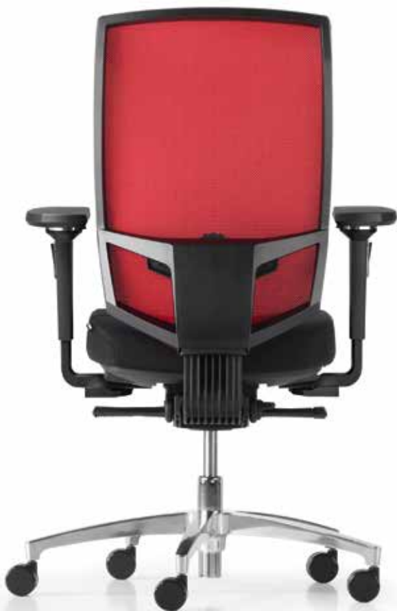
QS AJ 5775_NPR mesh NPR (Web M) + Armlehnen | Armrests A618KGS

The perfect combination of ergonomics and design. The swivel chairs with height-adjustable, breathable mesh backrests with black or white plastic frame offer optimum comfort with an extremely aesthetic appearance. A choice of two ergonomic systems is available: Syncro-Smart-Automatic® or, alternatively, Syncro-Quickshift®.