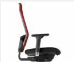
@Just magic2 Sitz- und Rückenpolster ohne seitliche Nähte (Standard) Seat and backrest upholstery with-out side seams (standard)