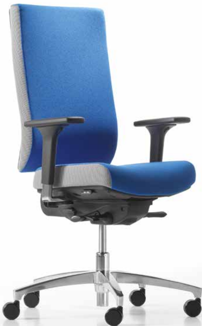
QS AJ 4874 operator XL + Armlehnen | Armrests A441APO

The @Just magic2 range satisfies the exact requirements when it comes to ergonomics, timeless styling, ease of operation, and optimised price-performance ratio. In terms of design, the swivel chairs with height-adjustable, upholstered backrests are deliberately timeless and focus on your individual needs. And with just a few simple steps, you can adjust your chair so that even long periods of time spent sitting are not a problem.