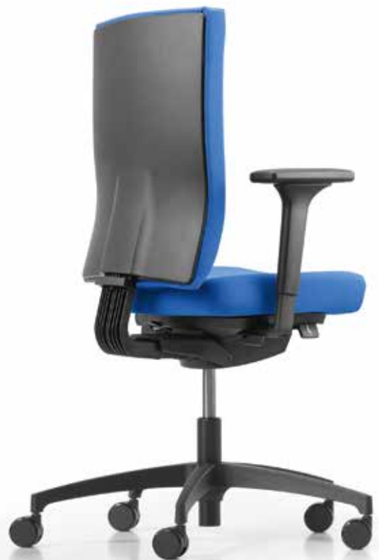
TA AJ 4849 operator + Armlehnen | Armrests A241KGS