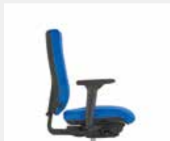
@Just magic2 XS Wie @Just magic2, jedoch mit verkürztem Sitz (35 cm) für kleinere Personen Same as @Just magic2 but with shortened seat (35 cm) for smaller persons