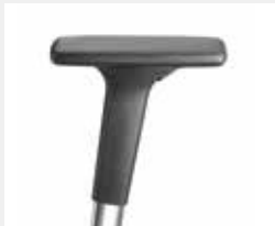
A341APO / A441APO (3F/4F) Armauflagen PU soft Armpads PU soft