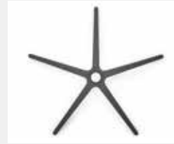
FHKGS Kunststoff schwarz (Standard) Black plastic (standard)