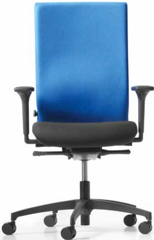
QS AJ 4877 operator + Armlehnen | Armrests A341KGS