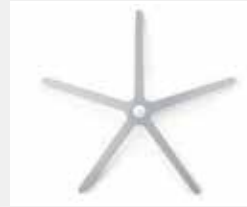
FHAMS Aluminium silber (Option) Aluminium silver (option)