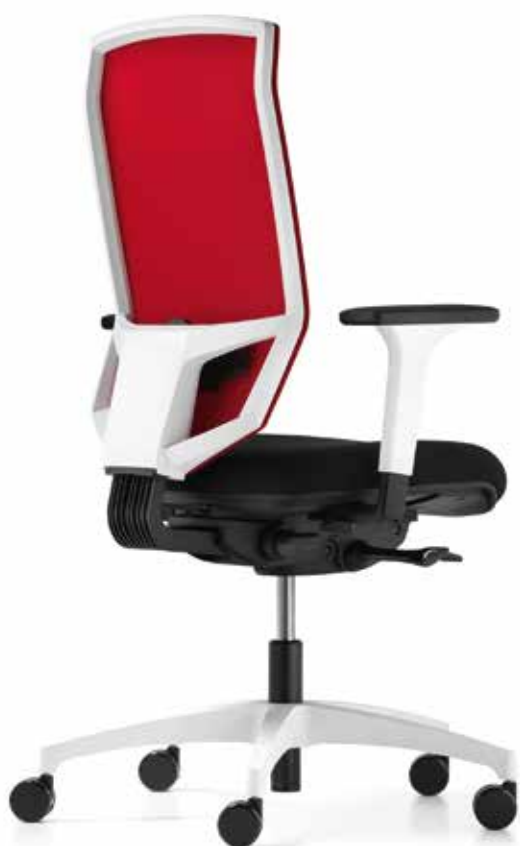
QS AJ 5777 mesh white edition (Web M) + Armlehnen | Armrests A341KGS