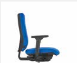
@Just magic2 Sitz- und Rückenpolster ohne seitliche Nähte (Standard) Seat and backrest upholstery with-out side seams (standard)