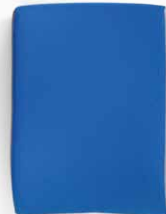
hoch | high