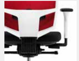
KVV Verkehrsweiß (~ RAL 9016) Traffic white (~ RAL 9016)

* Farbe der Armlehnenhülse = Modellfarbe Colour of armrest cover = model colour