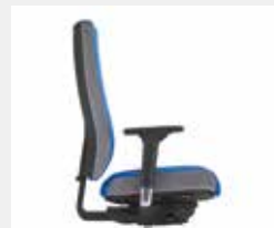
@Just magic2 XL/NPR bico Sitz- und Rückenpolster mit seitlichen Nähten und silbergrau abgesetzten Polsterböden Seat and backrest upholstery with side seams and silver grey contrasting facings