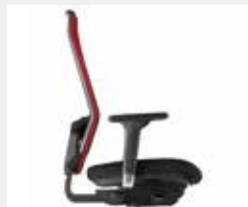
@Just magic2 XS Wie @Just magic 2, jedoch mit verkürztem Sitz (35 cm) für kleinere Personen Same as @Just magic2, but with shortened seat (35 cm) for smaller persons