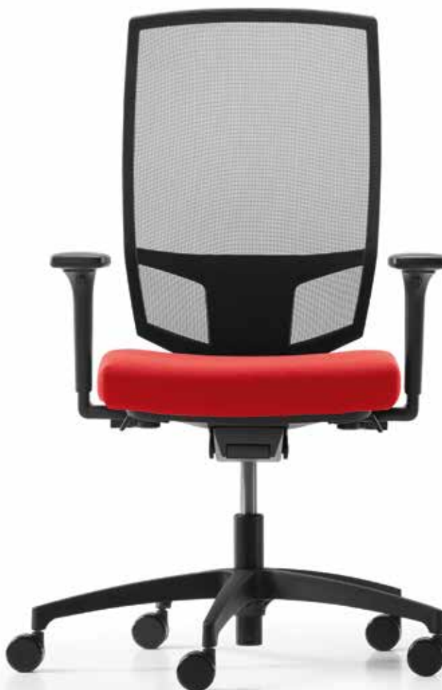
TA AJ 5779 mesh (Web S) + Armlehnen | Armrests A241KGS