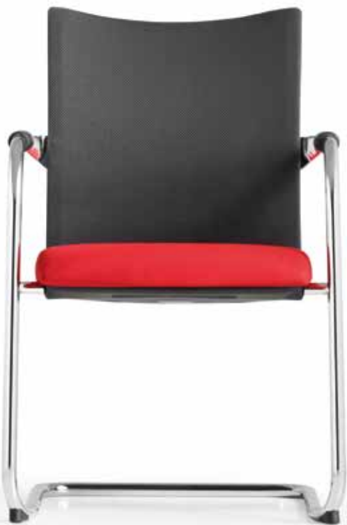
TO 3931 Armauflagen (PA) | Armpads (PA) AA01KGS Armauflagen (PU) | Armpads (PU) AA03KGS (Abb. Seite 12 | Ill. page 12)