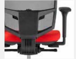
KGS Schwarz (RAL 9011) Black (RAL 9011)