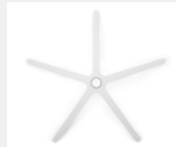
FHKVW Kunststoff weiß (Option) White plastic (option)