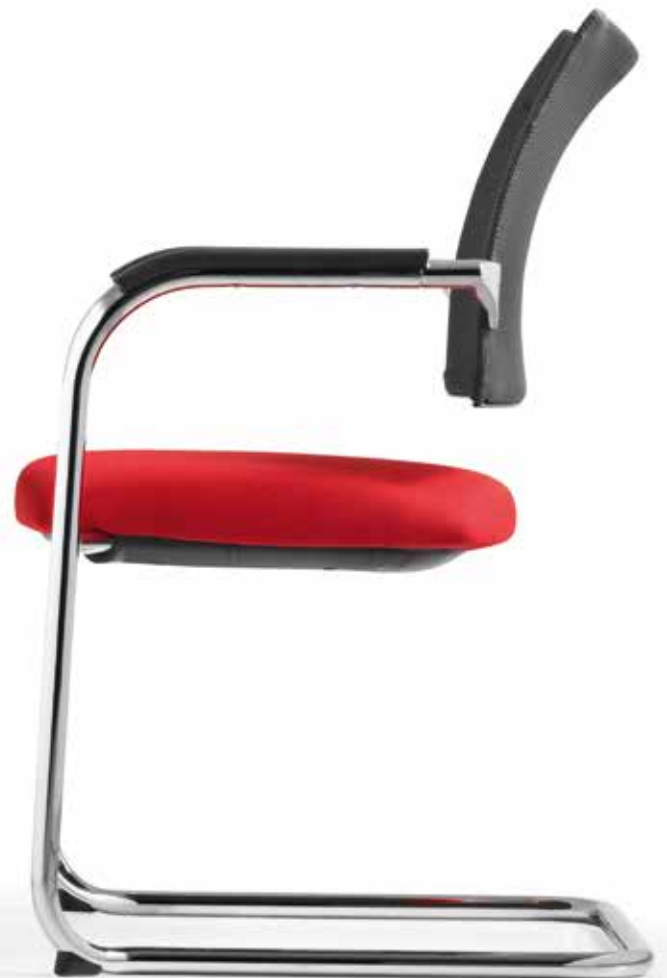
TO 3932 Armauflagen (PU) | Armpads (PU) AA03KGS 3fach stapelbar | stackable up to 3-high