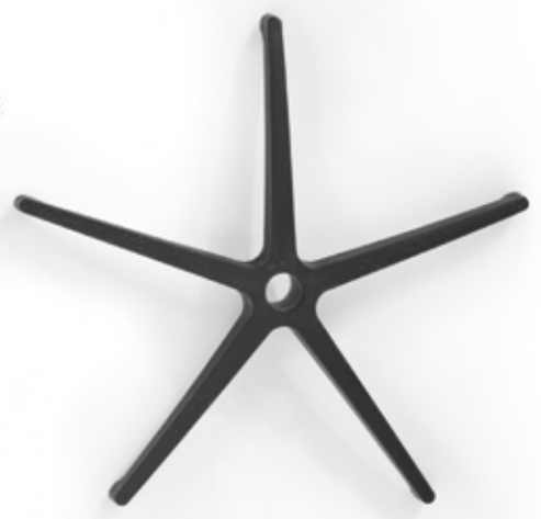
Schwarz | Black