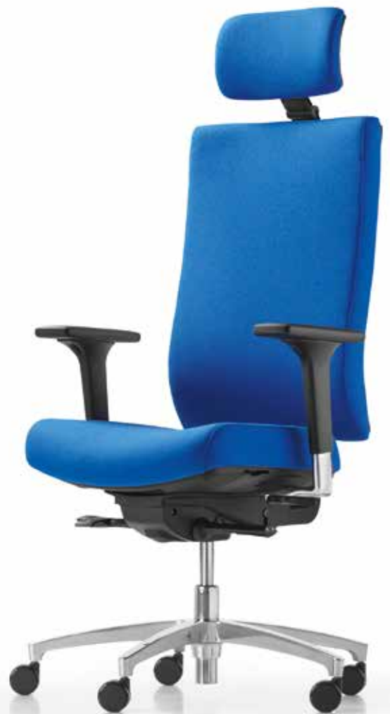
QS AJ 4891 operator XL + Armlehnen | Armrests A441APO