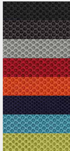
Web M (100% Polyester) Abstandsgewebe (3 mm) in 8 Farben (Option) Spacer fabric (3 mm) in 8 colours (option)