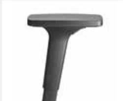
A240KGS (2F) Armauflagen PU Armpads PU