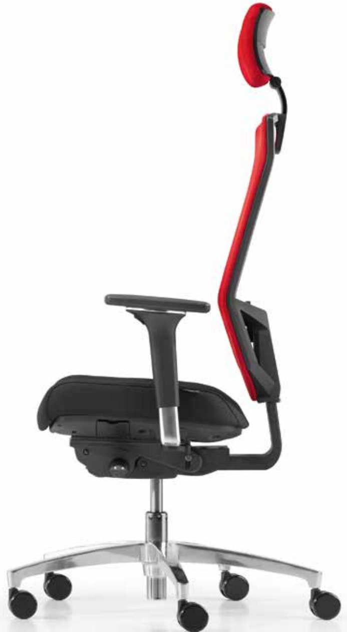
QS AJ 5785 mesh XL (Web M) + Armlehnen | Armrests A541APO