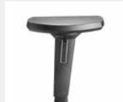
A618KGS (6F, NPR) Armauflagen PU soft Armpads PU soft

*mit antibakterieller Mikrosilberausrüstung zum Schutz vor Infektionen with antibacterial microsilver finish to help prevent infections