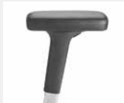
A442APO (4F) Leder-Armauflagen Leather armpads