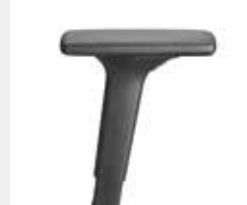
A441KGS (4F) Armauflagen PU soft Armpads PU soft