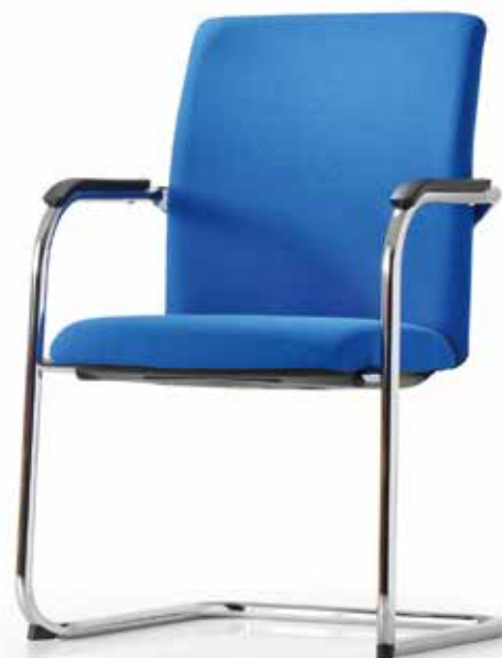
TO 3934 Armauflagen | Armpads AA03KGS 3fach stapelbar | stackable up to 3-high

Die überzeugende Ergänzung zum @Just magic2 operator Drehstuhl-Programm: Die Freischwinger bieten mit ihren komfortablen Vollpolster-Rückenlehnen besonderen Sitzkomfort für Gäste und Besucher.