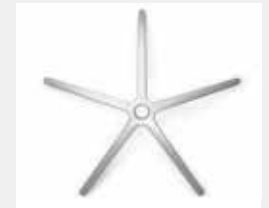
FHAPO Aluminium poliert (Option) Aluminium polished (option)