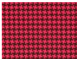
167.140 Koralle Coral