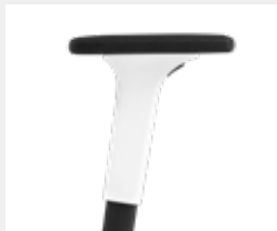
A241KGS* (2F) Armauflagen PU soft Armpads PU soft