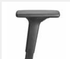
A441KGS (4F) Armauflagen PU soft Armpads PU soft