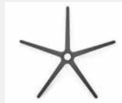
FHKGS Kunststoff schwarz (Standard) Black plastic (standard)