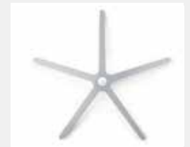
FHAMS Aluminium silber (Option) Aluminium silver (option)