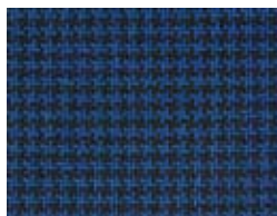
167.028 Marineblau Navy blue