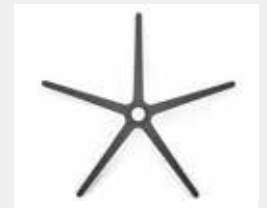
FHKGS Kunststoff schwarz (Standard) Black plastic (standard)