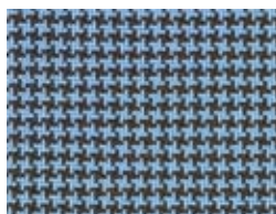
167.120 Hellblau Light blue