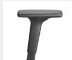
A341KGS / A348KGS* (3F) Armauflagen PU soft Armpads PU soft