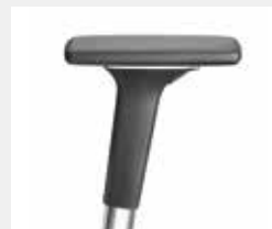
A541APO (5F) Armauflagen PU soft Armpads PU soft

*mit antibakterieller Mikrosilberausrüstung zum Schutz vor Infektionen with antibacterial microsilver finish to help prevent infections