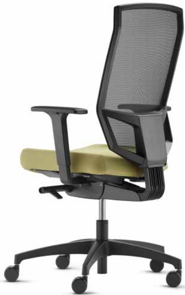
SE AJ 5776 mesh + Armlehnen | Armrests A246KGS Netz | Mesh Web S schwarz | Midnight black