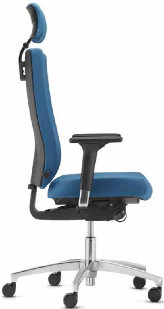
SE AJ 4896 + Armlehnen | Armrests A441APO

The perfect combination of ergonomics and design. The @Just evo swivel chairs with height-adjustable upholstered backrests offer optimum comfort with a dynamic aesthetic appearance. You can choose from three backrest versions: medium-high, high or high with Ergo neckrest.