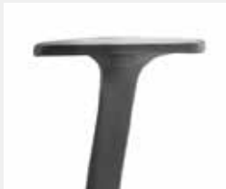
A246KGS (2F) Armauflagen PU soft Armpads PU soft