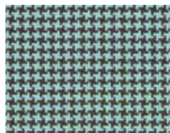
167.016 Wassergrün Ice green