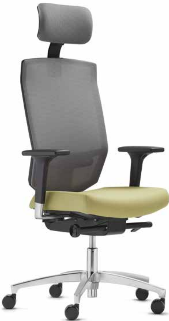
SE AJ 5786 mesh + Armlehnen | Armrests A441APO Netz | Mesh Web M Platingrau | Platin

The distinctive mesh backrest catches the eye instantly. It allows an active yet relaxed seated posture and provides optimum breathability. The optional Ergo neckrest offers even more seating comfort, is height-adjustable and tiltable.