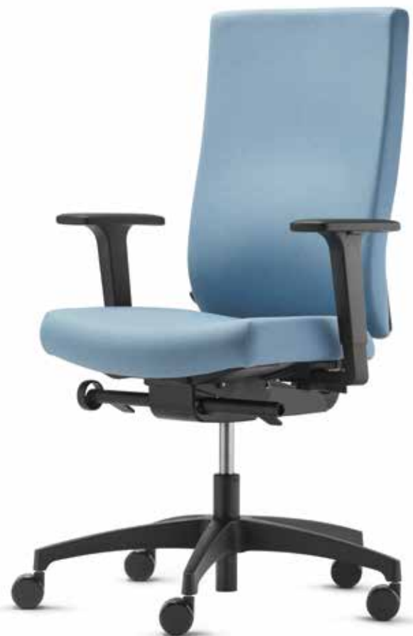
SE AJ 4846 + Armlehnen | Armrests A246KGS