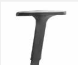
A246KGS (2F) Armauflagen PU soft Armpads PU soft