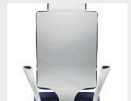
KVW Verkehrsweiß Traffic white (RAL 9016)