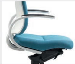
AS13AVW Starre Loop-Armlehnen, Armauflagen PU schwarz, Armlehnen-träger Aluminium weiß Fixed loop armrests, black PU arm-pads, white aluminium supports