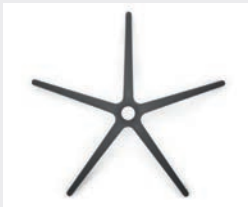
FHKGS Kunststoff schwarz (Standard) Black plastic (standard)