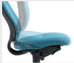
Integrierte Sitzneigeverstellung im Bewegungsablauf bis -4° (aktive Beckenkammstütze; NA) Integrated seat-tilt adjustment (up to -4°) during the movement process (active pelvic support; NA)