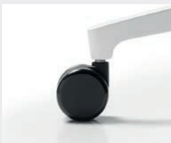
Standard-Rollen (Ø 60 mm): Harte Rollen für weiche Böden (R75HGS), weiche Rollen für harte Böden (R75WGS) Standard castors (Ø 60 mm): hard castors for soft floors (R75HGS), soft castors for hard floors (R75WGS)