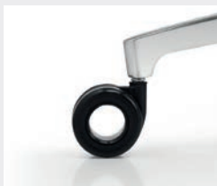
Design-Rollen (Ø 65 mm) (nur mit Aluminium-Fußkreuz): Harte Rollen für weiche Böden (R79HGS), weiche Rollen für harte Böden (R79WGS) Design castors (Ø 65 mm) (only with aluminium base): Hard castors for soft floors (R79HGS), soft castors for hard floors (R79WGS)