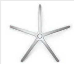
FHAPO Aluminium poliert (Option) Aluminium polished (option)