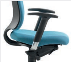
A204APO (2F)* Armauflagen PU schwarz, Armlehnen-träger Aluminium poliert Black PU arm-pads, polished aluminium supports