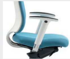
A204APO (2F)* Armauflagen PU schwarz, Armlehnen-träger Aluminium poliert Black PU arm-pads, polished aluminium supports