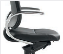
AS13APO Starre Loop-Armlehnen, Armauflagen PU schwarz, Armlehnen-träger Aluminium poliert Fixed loop armrests, black PU arm-pads, polished aluminium supports