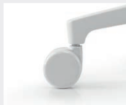
Weißer Rollen (Ø 60 mm): Harte Rollen für weiche Böden (R75HVW), weiche Rollen für harte Böden (R75WVW) White castors (Ø 60 mm): hard castors for soft floors (R75HVW), soft castors for hard floors (R75WVW)