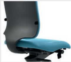
Höhenverstellbare Lumbalstütze (6 cm; L06) Height-adjustable lumbar support (6 cm; L06)