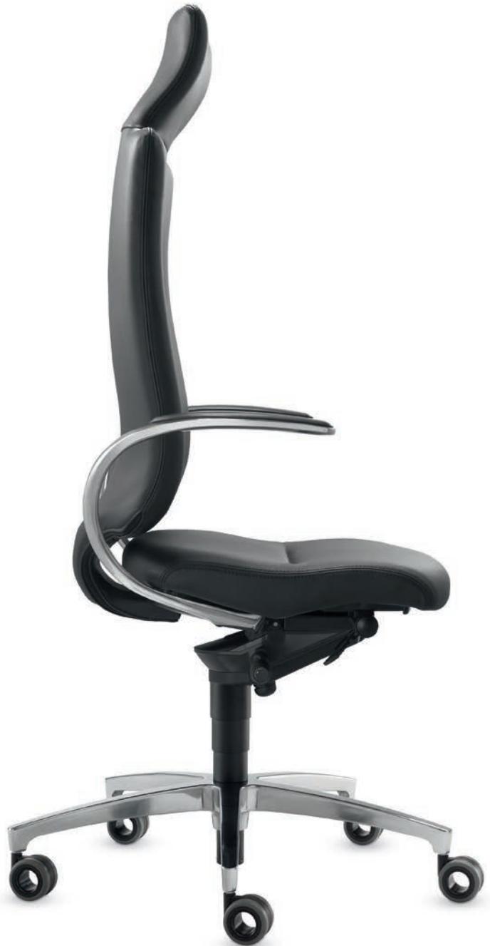
SD IT 5450 + Armlehnen | Armrests AS14APO