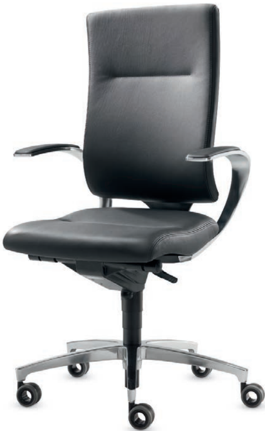
SD IT 5440 + Armlehnen | Armrests AS14APO