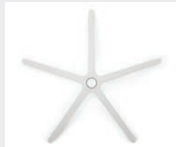
FHAVW Aluminium weiß (Option) White aluminium (option)