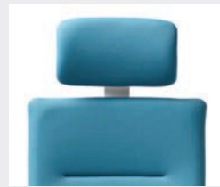
Ergo-Nackenstütze Höhenverstellbar (7 cm) und 40° neigbar Ergo neckrest Height-adjustable neckrest (7 cm) and 40° tiltable