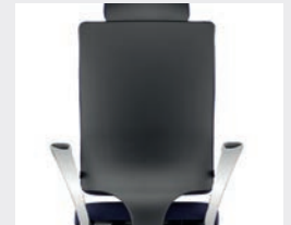
KGS Graphitschwarz Graphite black (RAL 9011)