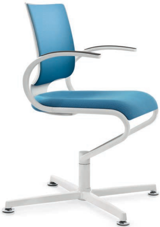
IT 5409 Armauflagen (PU) | Armpads (PU) AA03KGS

InTouch follows the movements of its user with its three-piece seat shell and backrest which is modelled on the shape of the body, and thus ensures perfect harmony for the person sitting on it. With a sleek organic design, the elastic and flexible Dauphin seat system supports the entire posture and locomotor system at all times in direct contact with the body. The white edition exudes fresh elegance and brings every detail of the dynamic design to the fore.