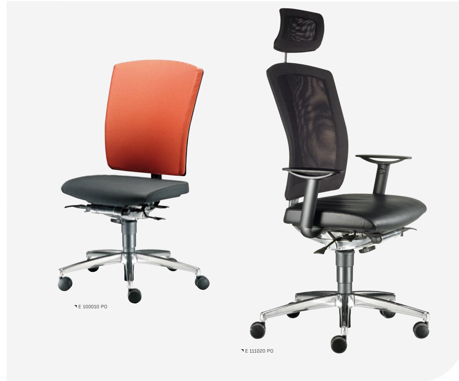
↘ E 100010 PO