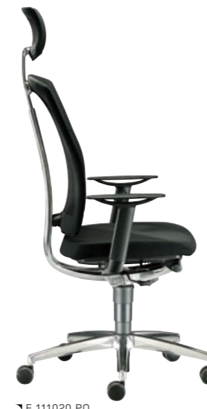
↘ E 111020 PO

| NL | DE FUNCTIED DRAAISTOEL overtuigt met gepatenteerde synchron-mechaniek «Dyna-Spring», geïntegreerde schuifzitting en comfort-armleuningen.