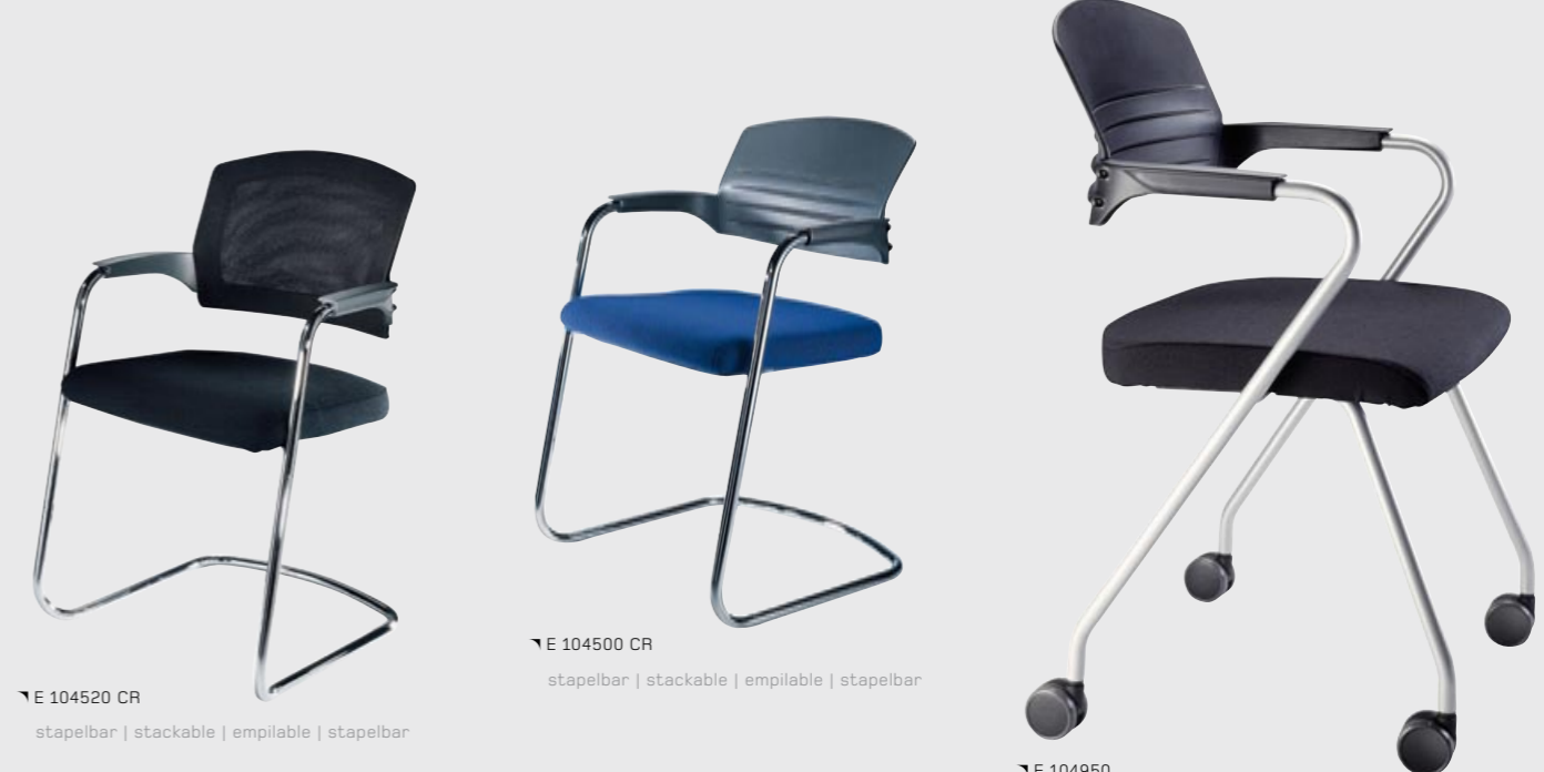
↙ E 104520 CR stapelbar | stackable | empilable | stapelbar