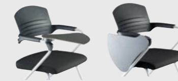
↙ E 104950 stapelbar | stackable | empilable | stapelbar

| D | lieferbar mit schwenk- und klappbarer Schreibplatte und mit Reihenverbindern