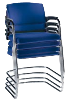
↙ E 104510 CR

| NL | leverbaar met zwenk- en klappbarer Schreibplatte en met Reihenverbindern