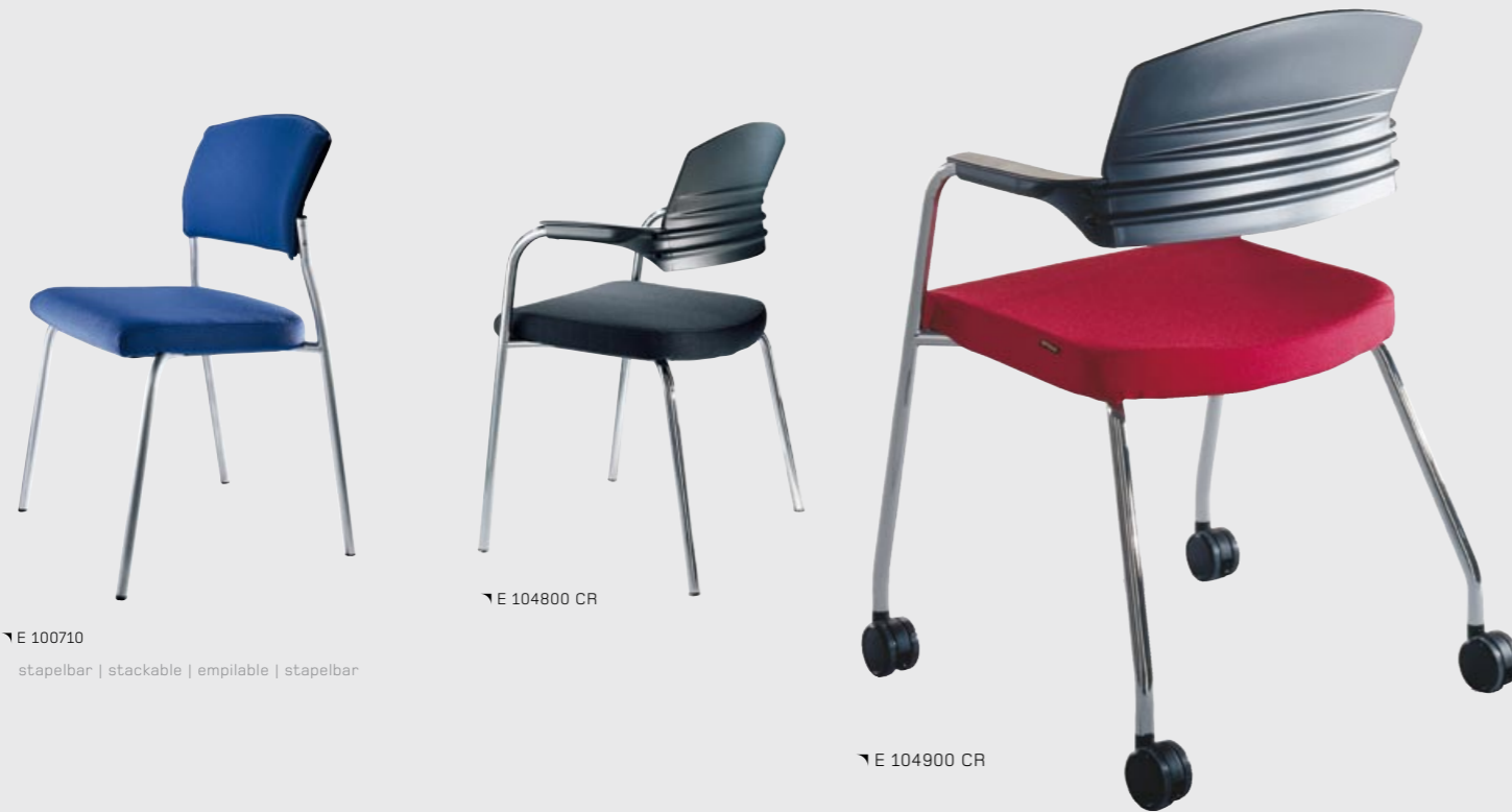
↙ E 100710 stapelbar | stackable | empilable | stapelbar

| NL | De bezoekersstoel past zich ongecompliceerd aan kleine en grote ruimtes aan.